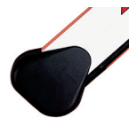
Držák obdélníkového ráhna ♦

Obdélníková ráhna mají integrovaný gumový profil a pro správné vyvážení závory nelze použít "aktivní" bezpečnostní lištu.