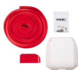
Kit osvětlení pro obdélníková ráhna