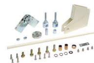
Kloubový kit pro zlamovací obdélníková ráhna (maximální výška stropu 3 m)