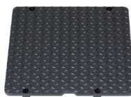
Kryt jámy JC275