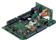
Cobra 5000 Plus s napájecím zdrojem a LM boxem (IP55)