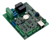
RS485 door controller