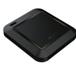
Čip - keytag (13,56 MHz)