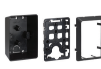
Externí adaptér na zeď ♦