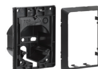
Adaptér pro sloupek nebo pod omítku ♦