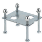
Základová deska pro hliníkový sloupek