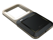
Čip - kovový keytag (13,56 MHz)