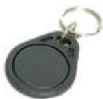
Čip v přívěsku (125 kHz)