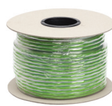
100 m krouceného kabelu pro BUS sběrnici