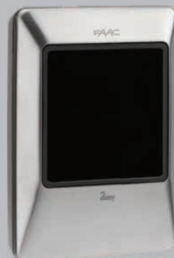
XTR B INOX